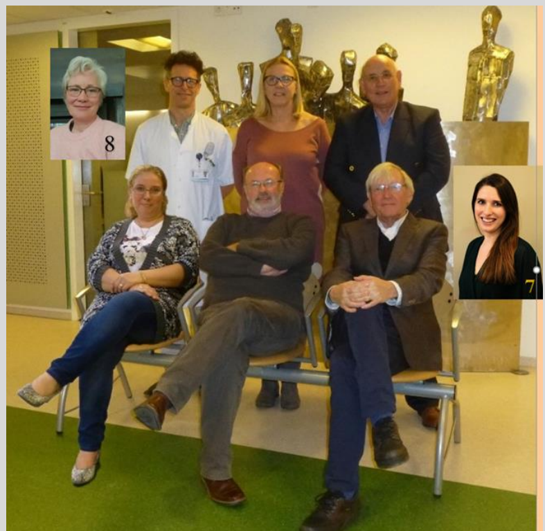
van L-R staande: 3, 4, 5; zittende: 6, 1, 2