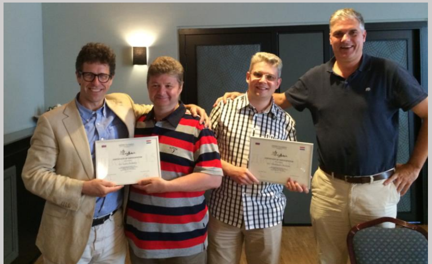
DEMMA guests together with the coordinators after handing over the certificates