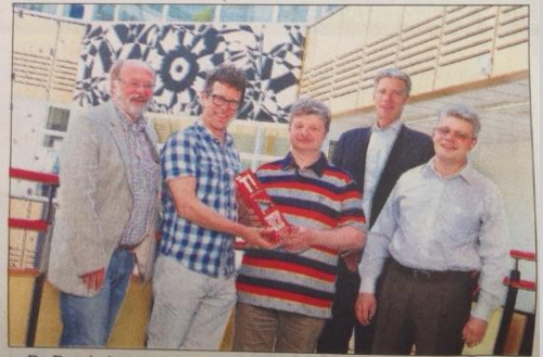
■ De Russische artsen in het Scheperziekenhuis in Emmen.

gen heeft geleid in het ziekenhuis van Mytishchy op onder andere het gebied van KNO en Cardiologie. Meer informatie over het uitwisselingsproject is te lezen op www.demma.nl .