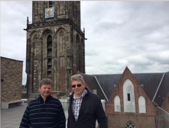
Groningen June 9th. in front of the Martini tower